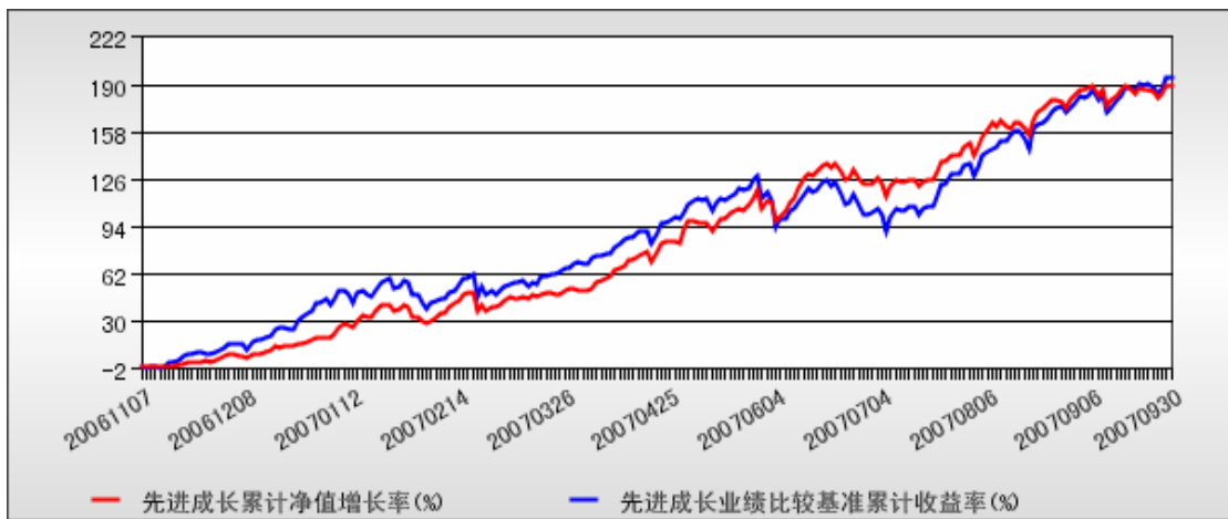
先进成长基金累计份额净值增长率与同期业绩比较基准收益率的历史走势对比图 （2006 年 11 月 7 日至 2007 年 9 月 30 日）

注：1、本基金合同于 2006 年 11 月 7 日生效，截至报告日本基金合同生效未满一年。